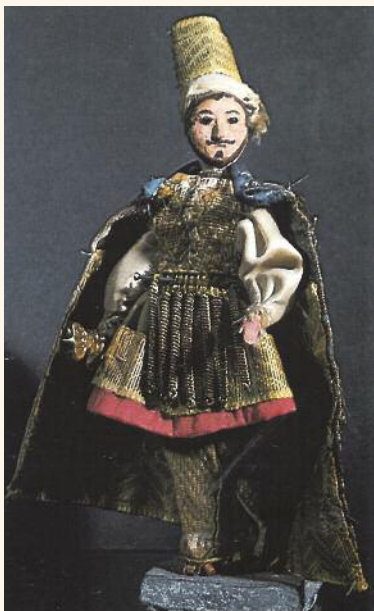
Un santon de Balthasar, un des 3 Rois mages de la Nativité - Collection Museon Arlaten.

MARDI 10 FÉVRIER À 19H: Ethno bistrot « Sarrasins en Provence »