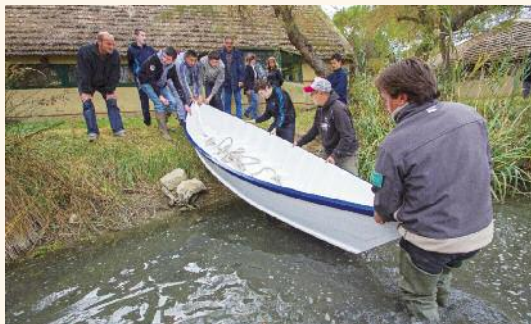
Mise à l'eau d'une nacelle construite avec des collégiens © Association Siloë.

Camargue communication, l'atelier papetier, l'association Siloë, Sud engrais distribution, Société commerciale agricole de distribution, le Tabac du centre, Groupement cynégétique arlésien, l'Association des marais du Vigueirat, l'association Déducima, Cévennes Composites, la Coopaport, Port Gardian, l'Atelier Mijo, Paul Scotti.